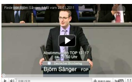
Rede vom 27. Januar zur Umsetzung der OGAW-IV-Richtlinie

Die komplette Rede finden Sie auf www.bjoern-saenger.de